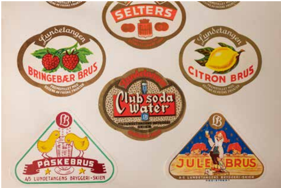
Arkivet etter Lundetangen Bryggeri inneholder også disse fine etikettene, i dag både nostalgi for bruselskere og en del av norsk designhistorie. Legg merke til at seltersen har Skien kommunes byvåpen på etiketten.