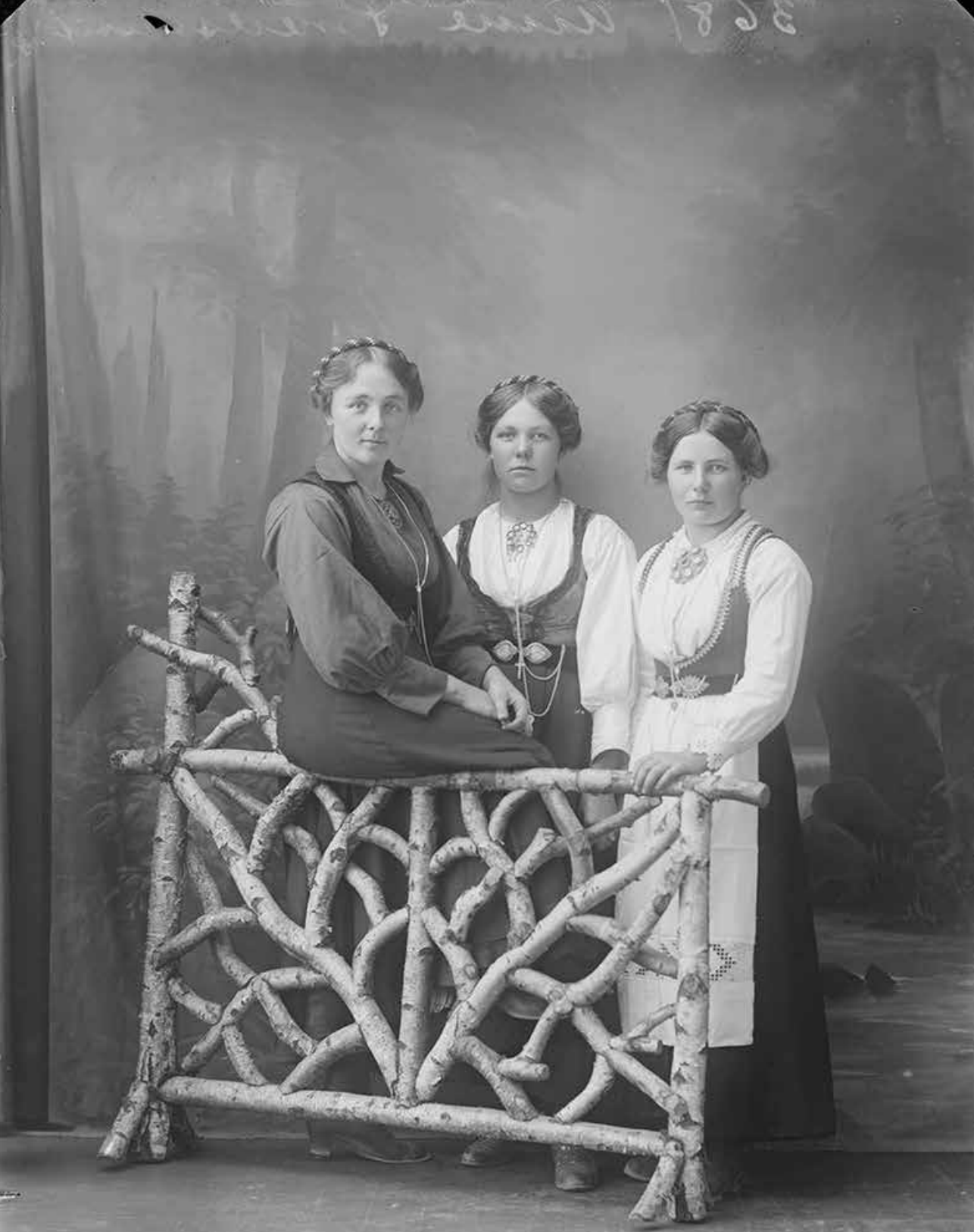
Kaja Pedersen hadde fotostudio på Notodden. Den særegne hjemmelagde rekvisitten som den ene damen sitter på, var en gjenganger i hennes bilder.