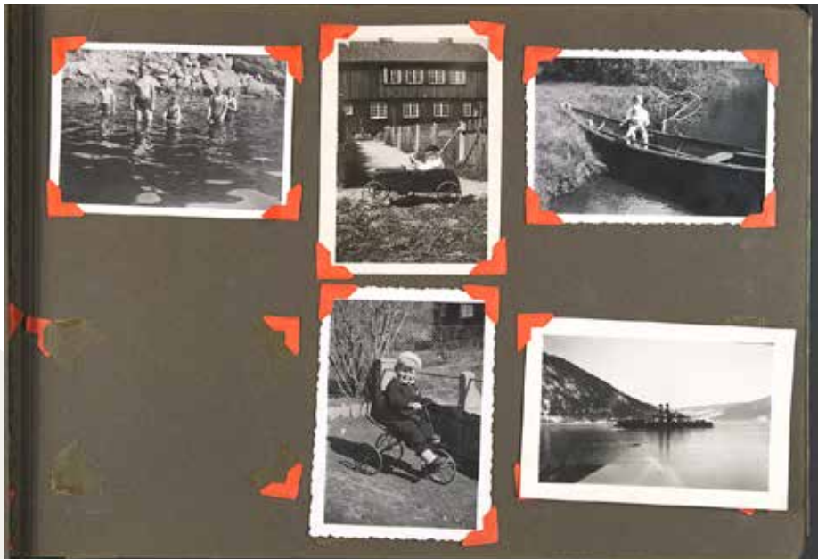
Dette er en side fra et album fra Tor Åge Andersens samling. Et bilde er blitt fjernet fra albumet før det kom til museet. Motivene er fra Tinn.